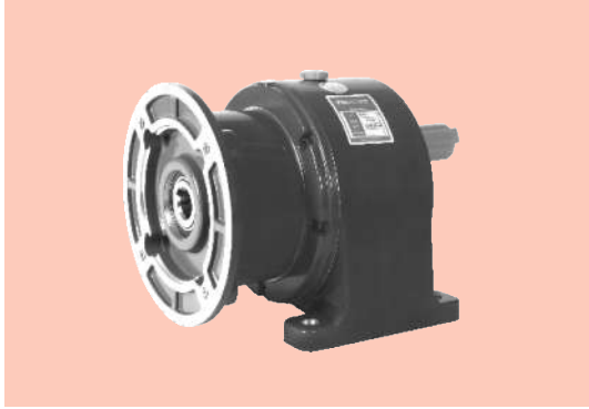
■ ZHM 卧式 ZHM Horizontal