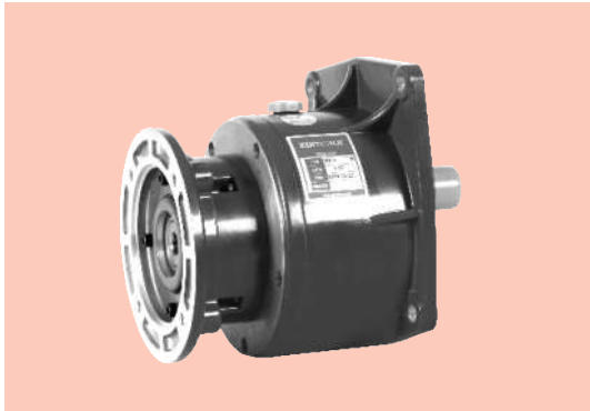
■ ZVM 立式 ZVM Vertical