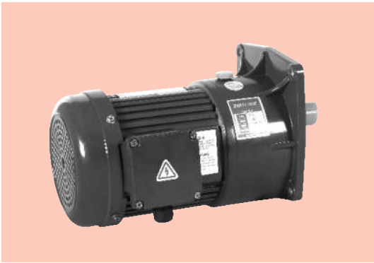
■ 立式 Vertical