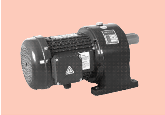
■ 卧式 Horizontal