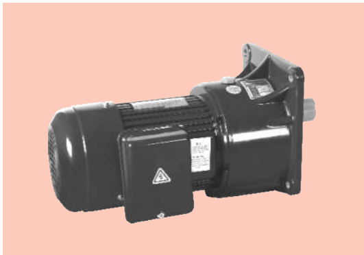
■ 立式 Vertical