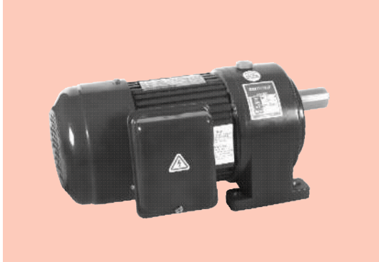
■ 卧式 Horizontal